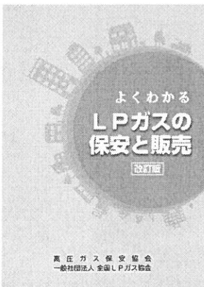
(2) 消費者生活用製品安全法

新人クン カス機器の保安策についても液化石油ガス法以外の規制があります。 ベテランさん 「4.LPガスの法令」で概要を紹介しましたが、最近の動きとしては、重大製品事故の発生を受けて消費者生活用製品安全法が改訂され、2007年(平成19年)5月からは重大製品事故防止の徹底化、2008年(平成20年)4月には従来が化学事故を防ぐ「長期使用製品安全規制案」が削除され、LPガス機器も「屋内改訂スチール製機器」と「同カスルガス」が対象製品となりました。そのほか、消費者生活に対する製品責任法(PL法)も理解しておくといへばいいでしょう。